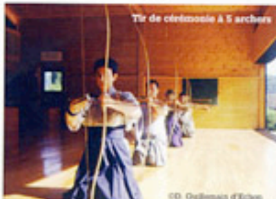
Tir de cérémonie à 5 archers

D'après la Fédération de Kyudo Traditionnel, à la recherche de la qualité de la posture et de la gestuelle du tir développe une meilleure connaissance de son propre corps et le rééquilibrage de ses énergies. Les enchaînements de postures aident à faire travailler l'ensemble du corps. Lorsque l'arc est tendu, c'est toute la respiration abdominale qui travaille, favorisant l'assouplissement des articulations. Dignité et courtoisie sont les maîtres mots d'une discipline respectueuse de l'homme et de la nature, un art traditionnel tourné avant tout vers l'harmonie du corps et de l'esprit en une symbiose sans cesse renouvelée.